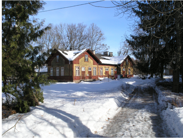
Pilt 5: Lina tn 4

Lina tn 8 on kompleksi vanim, 1830-ndatest pärinev puitkonstruktsioonis ühekorruseline klassitsistlikus stiilis hoone. Hoone algne maht on suuresti säilinud, kuid ruumijaotust on põhjalikult muudetud.