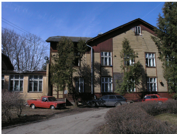
Pilt 7: Lina tn 6

Lina tn 6 on haigla põhihoone, ehitatud inglise paviljontüüpi haigla näitena.