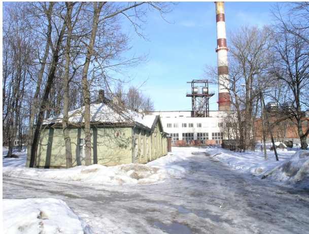
Pilt 6: Lina tn 8

Lina tn 8 on kompleksi vanim, 1830-ndatest pärinev puitkonstruktsioonis ühekorruseline klassitsistlikus stiilis hoone. Hoone algne maht on suuresti säilinud, kuid ruumijaotust on põhjalikult muudetud.