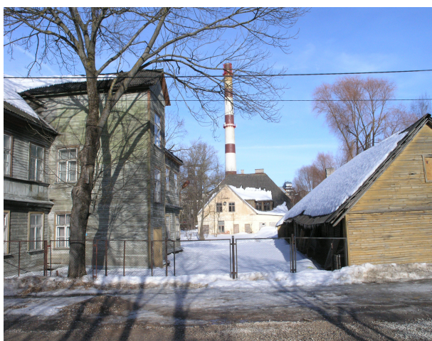
Pilt 2: paremal Lina tn 7, taga Lina tn 11, vasakul Lina tn 9

Lina tn 9 asub sisuliselt Lina tn 7 hoovis, ulatudes otsafassaadiga Aleksandri tänavale. Hoone on ühekorruseline valdavalt horisontaalpalkidest abihoone. Maja on ehitatud 1908. aastal.