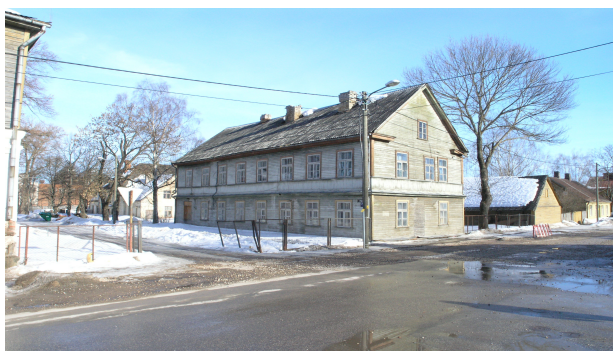
Pilt 1: Lina tn 7

Lina tn 7 paikneb Aleksandri- ja Lina tänava nurgal, pikema fassaadiga piki Lina tänavat. Hoone on kahekorruseline puitkonstruktsioonis viilkatusega korterelamu. Maja selline maht on 1901-st aastast, mil seal asus laste varjupaik ja hoonele ehitati teine korrus.