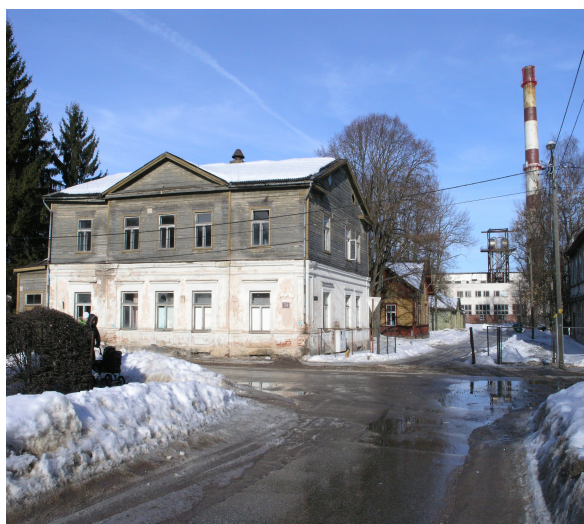
Pilt 4: Aleksandri tn 32

Aleksandri tn 32 on Lina ja Aleksandri tänava nurgal kahekorruseline viilkatusega klassitsistlikus stiilis hoone. Hoone esimese korruse välisseinad on kivikonstruktsioonist, teine korrus ja vahelaed on puitkonstruktsioonist. Hoone kivikonstruktsioonid on pärit 1827. aastast. Pealeehitus on hilisemast haigla-ajast.