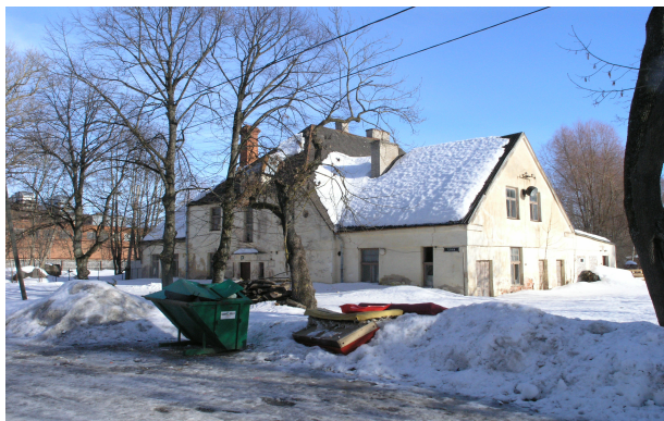
Pilt 3: Lina tn 11

asusid vastuvõturuum, pesuruum, kuivatusruum ja väljaandmisruum. Turu tänava pool asuvas tiibhoones oli katlamaja, mille tarvis oli rajatud kõrge telliskivikorsten. Aleksandri tänava pool asuvas tiibhoones paiknes desinfektsioonikamber. Teisele korrusele ehitati korterid.