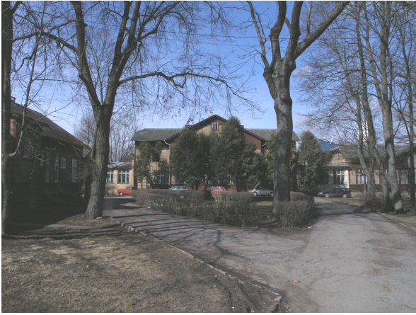
Pilt 8: aimatav ovaal haiglahoone ees